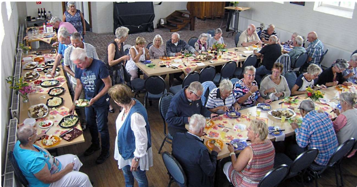
Afb. 9. Bijeenkomst brunch 7 augustus 2016

Dat aanbod is positief ontvangen, maar kan pas invulling krijgen als daarvoor bij de gemeente voldoende personele invulling beschikbaar is.