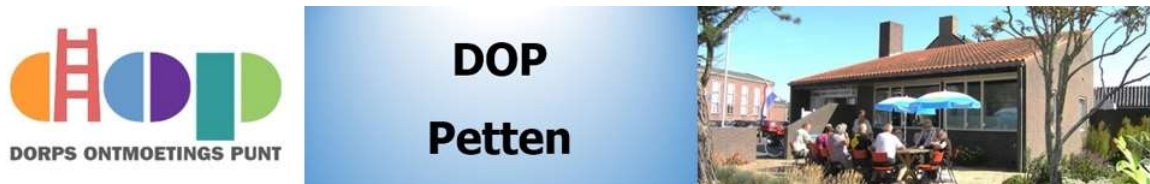
Afb. 4. Bovenbalk website www.doppetten.nl

Vanaf augustus 2015 is onze website www.doppetten.nl actief.