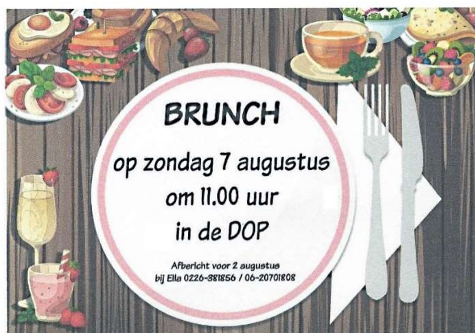
Afb. 3. Uitnodiging brunch, bestemd voor alle vrijwilligers en de vaste gasten van het DOP