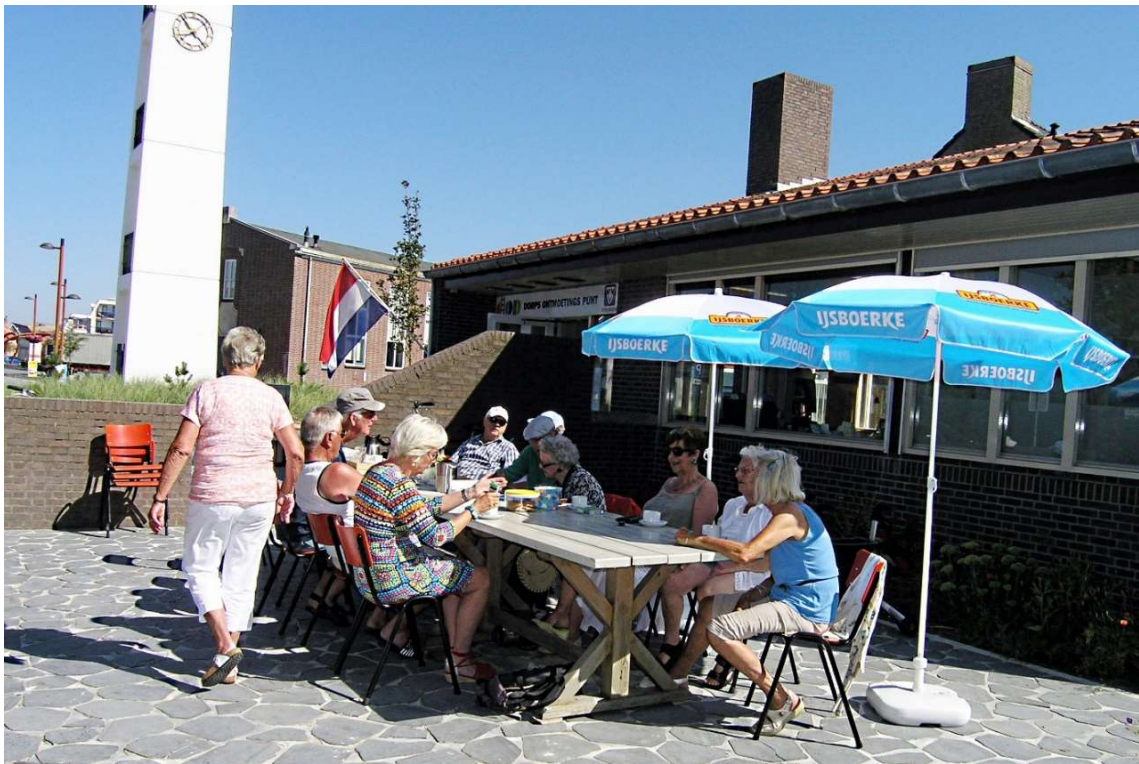
Afb. 12. Als het maar even van het weer kan wordt het buitenterras benut, 17 augustus 2016

Maar er waren geen wandel- en fietsroutes beschikbaar en geen lijst van activiteiten in de regio. We zijn in mei gestart met het ontvangen van binnenlopende gasten. Net als vorig jaar liep het in het begin niet erg, maar Pinksteren was er topdrukke (bij de boekverkoop) en werden die dagen ca. 100 bezoekers geteld. Tot november hebben we totaal 750 bezoekers te woord gestaan.