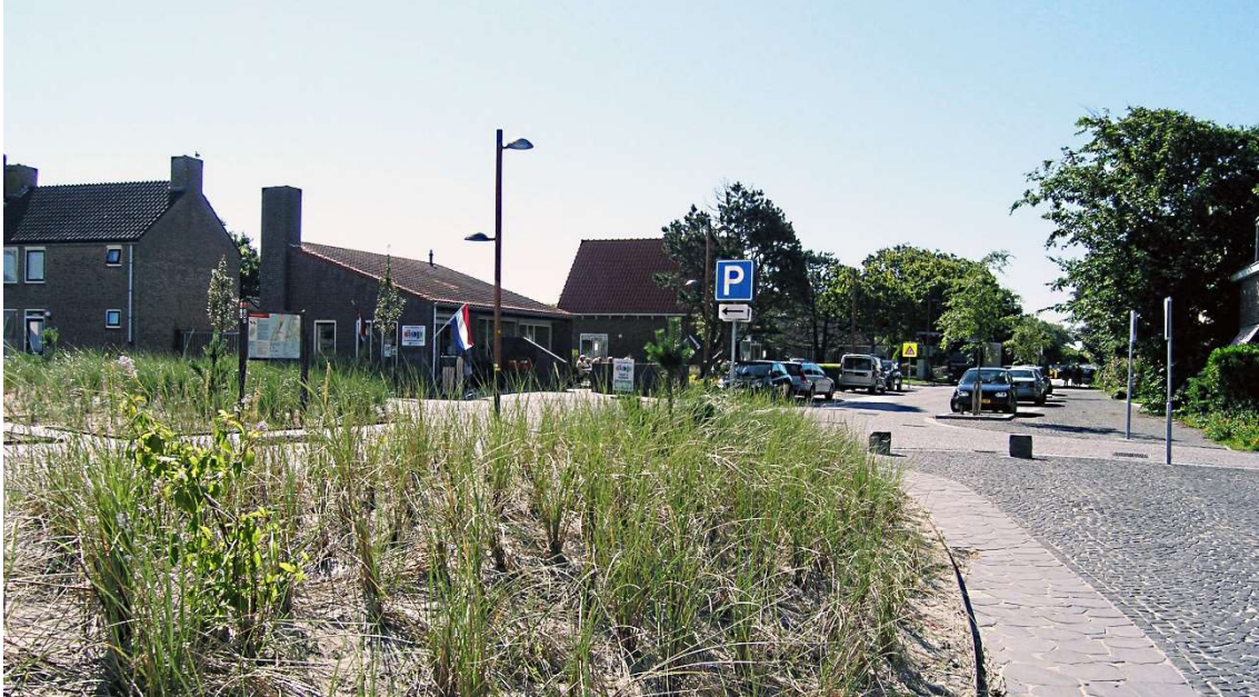
Afb. 14. DOP-gebouw ingepast in het nieuwe Plein 1945 op 20 juli 2016