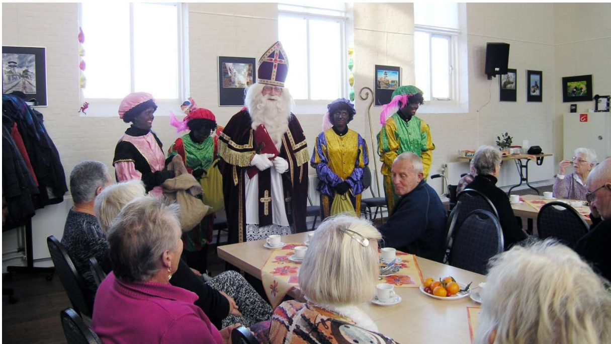
Afb. 11. Bezoek Sinterklaas aan het DOP 5 december 2016

Het werd al met al een erg geslaagde bijeenkomst.