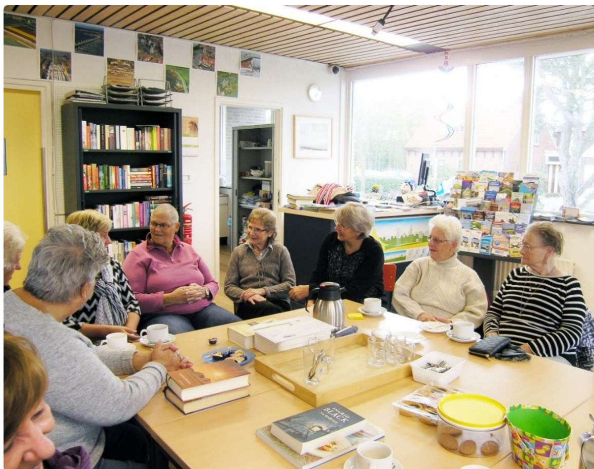
Afb. 16. Boeken en verhalen zijn interessante onderwerpen 07-11-2016

We gaan volgend jaar opnieuw plannen uitwerken om beschikbare ontvangen gelden voor diverse activiteiten in te zetten. We denken daarbij bijvoorbeeld aan het organiseren van een gezamenlijke maaltijd(en) en indien mogelijk een rondrit over de duinen en het strand.