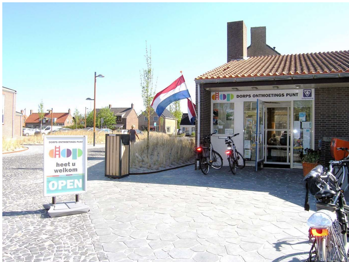
Afb. 1. Ingang Dorps Ontmoetings Punt Petten 2016

Daarnaast hebben we wederom themamiddagen georganiseerd, zie daarvoor hoofdstuk 6.