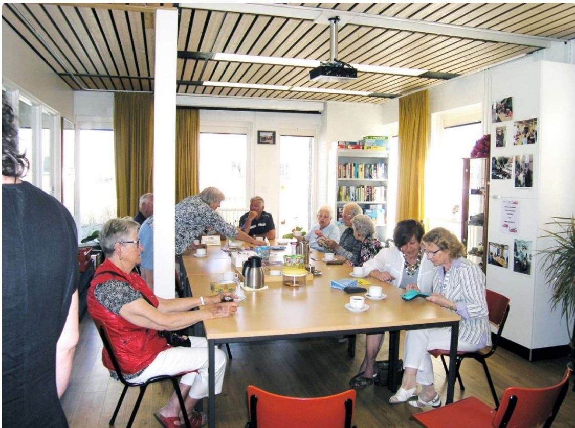
Afb. 8. Bijeenkomst DOP maandagmorgen 16 mei 2016