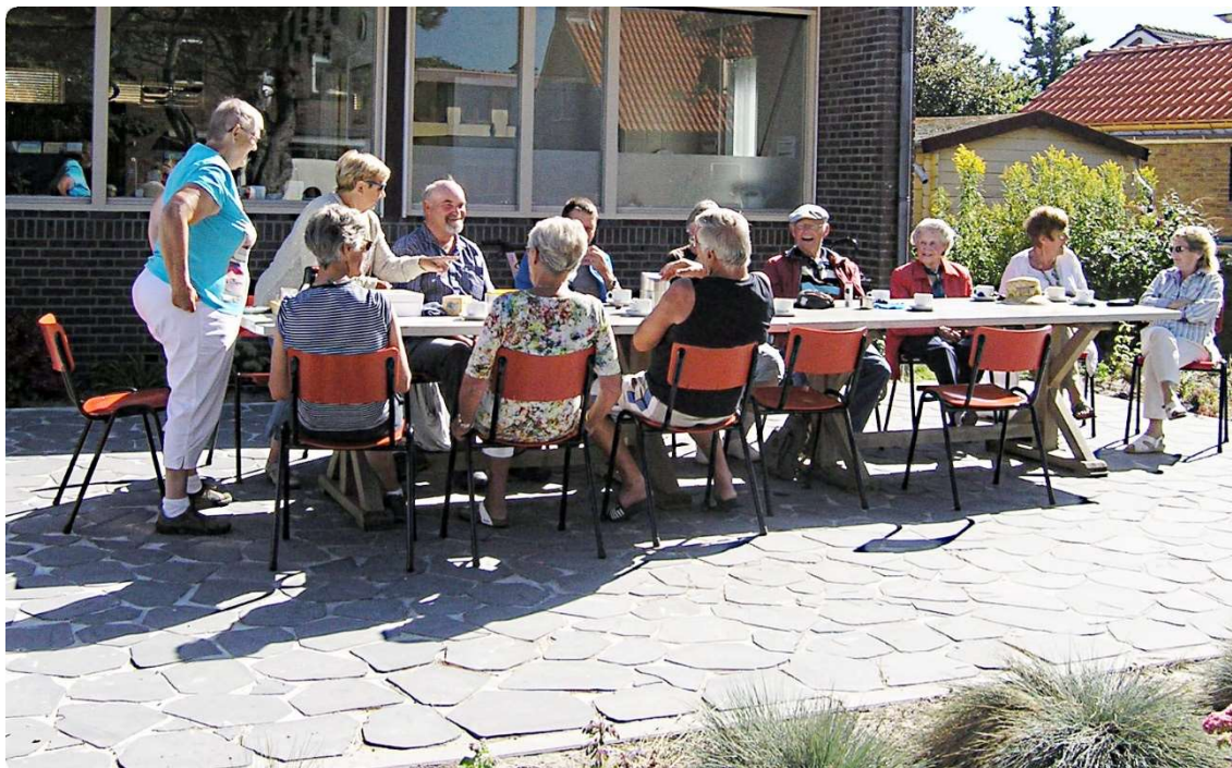
Afb. 7. Op 20 juli 2016 was het eindelijk mogelijk om buiten op het terras te zitten

Meer informatie over de VOA is op de homepage van onze site te vinden.