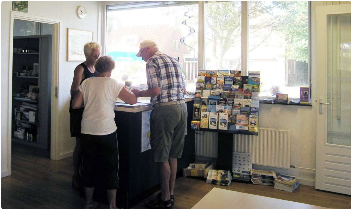
Afb. 10. Ook bij mooi weer als de gasten op het terras zitten worden de VVV gasten aan de balie te woord gestaan, 14 september 2016

Ter ondersteuning van deze informatievoorziening hebben we de oude computer weer inzetbaar gemaakt met Windows 10 om via internet zo nodig informatie te kunnen opvragen. Ook hebben we een telefoon aangeschaft voor geval dat er hulp nodig is.